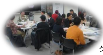
ゲストとの本音トーク(座談会)